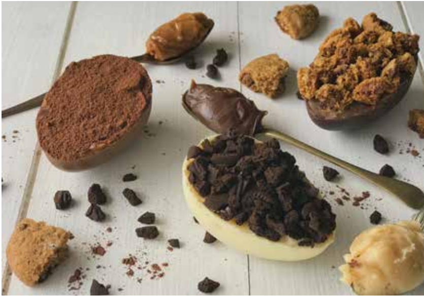
TRIO I BROWNIE & COOKIES, PÃO DE MEL E NEGRESCO. R$76,00