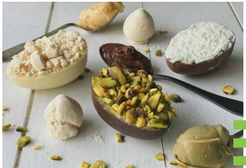
TRIO II PISTACHE, NINHO & NUTELLA E LIMÃO SICILIANO. R$78,00

• TODOS OS PEDIDOS DEVEM SER FEITOS ATRAVÉS DO EMAIL PASCOA@DAFEIRAAOBAILE.COM.BR OU PELO TELEFONE 11 30620450 OU PELO WHATSAPP 11 99775 8931 ATÉ O DIA 13 DE ABRIL COM RETIRADAS AGENDADAS ATÉ O DIA 20.