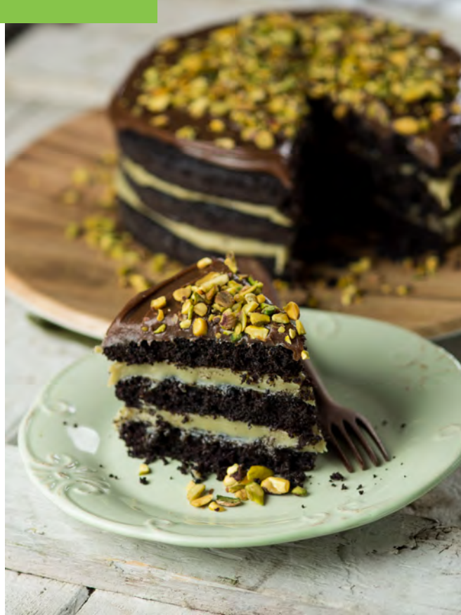
BROWNIE DE CACAU COM PISTACHE

Massa de brownie de chocolate belga meio amargo, recheio e cobertura de brigadeiro de chocolate, cookies de aveia quebrados por cima