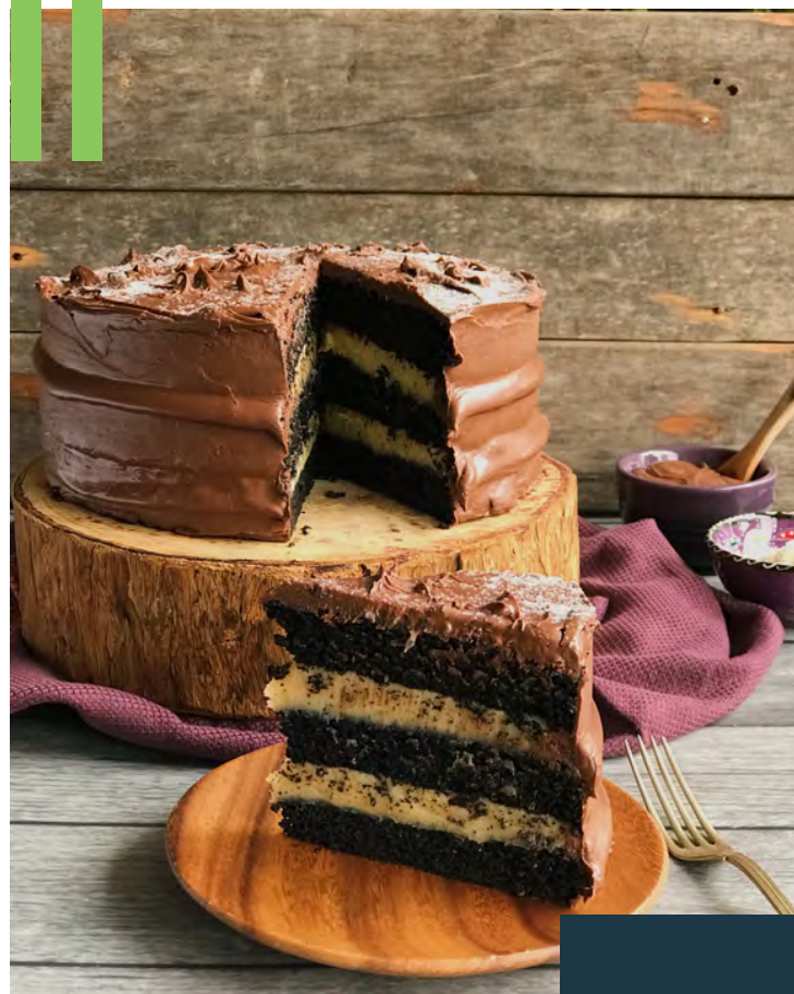
BOLO LEITE NINHO & NUTELLA®

Massa de chocolate, recheio de brigadeiro de chocolate com crocante, cobertura de brigadeiro de chocolate, crocante de castanhas por cima