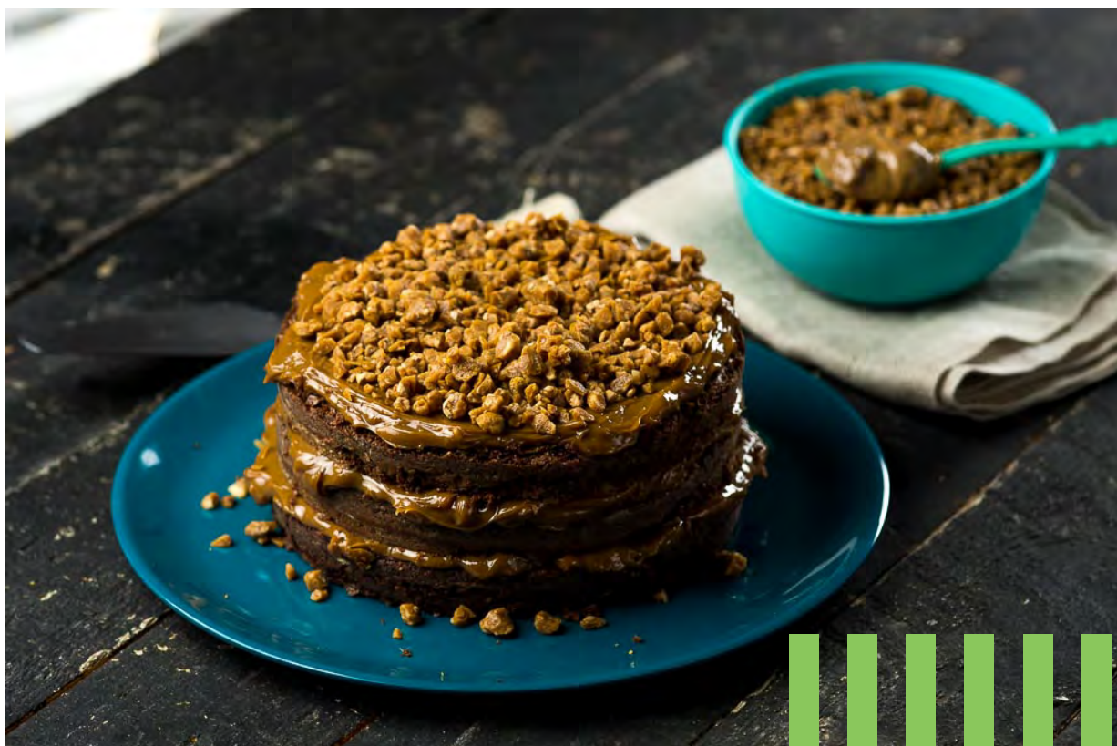
BROWNIE BELGA CROCANTE