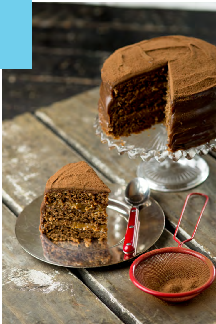
BOLO PÃO DE MEL

* opção com nibs de cacau + R$5,00/kg de bolo