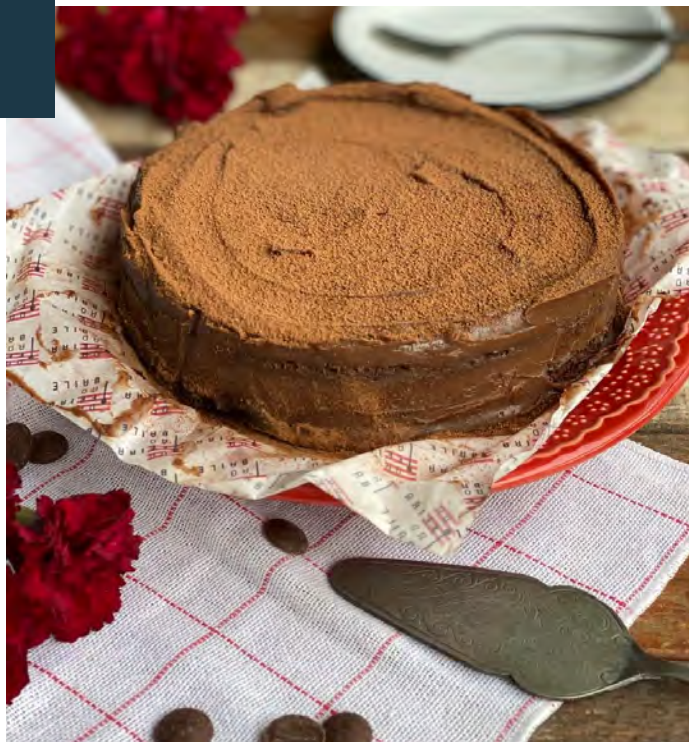
TORTA GATEAU DE CHOCOLATE

Adicional de frutas vermelhas: P - R$20/ M - R$40/ G - R$60