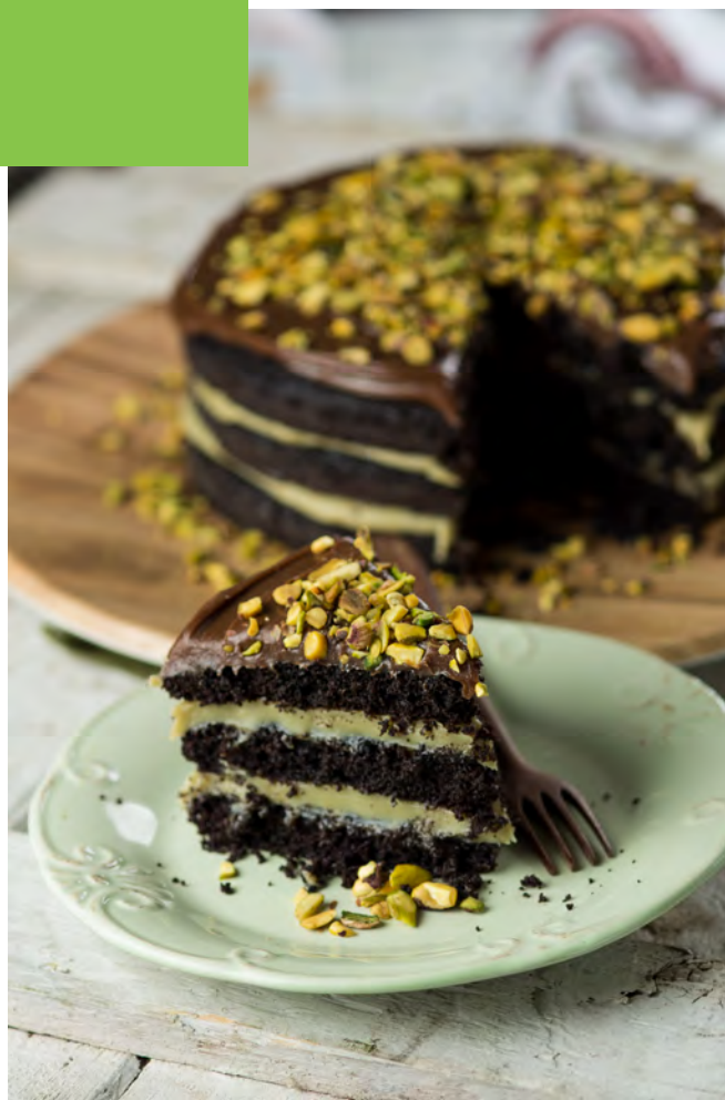
BROWNIE DE CACAU COM PISTACHE