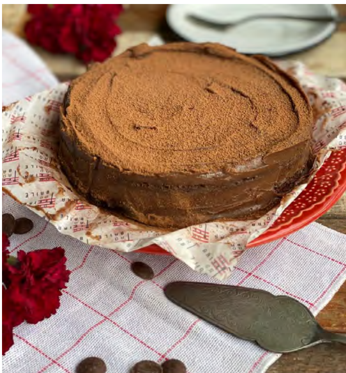
TORTA GATEAU DE CHOCOLATE